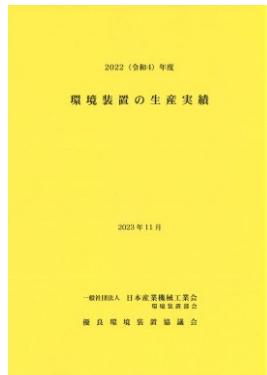
2022年度 環境装置の生産実績