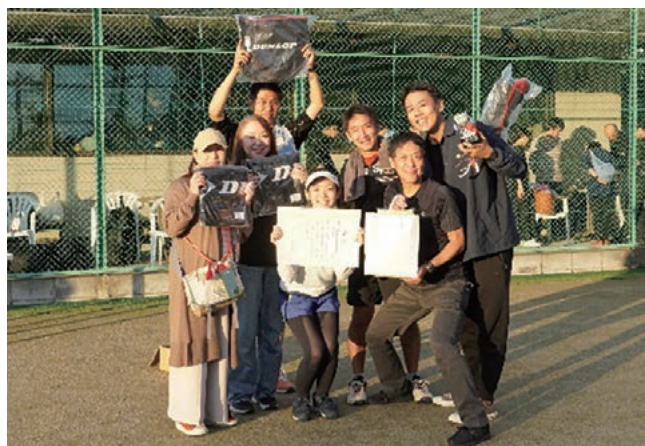
第3位の株式会社クボタ