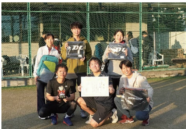
準優勝のオルガノ株式会社