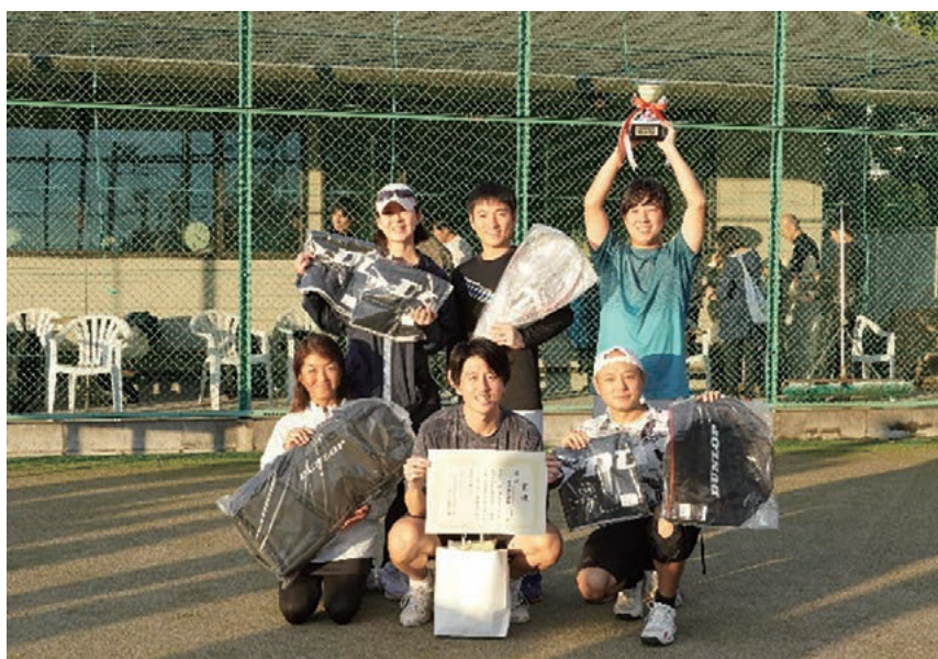
優勝した三菱重工業株式会社

なお、産業機械テニス大会は来年も開催いたします。会員会社の皆様におかれましては、奮ってのご参加をお待ちしております。