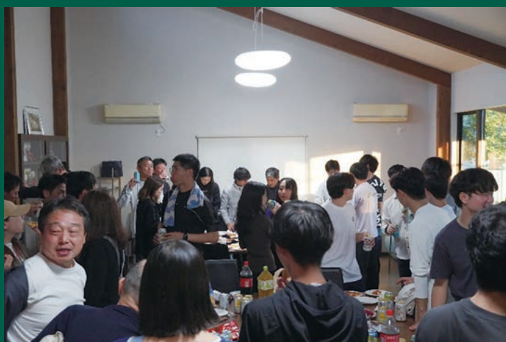
大会終了後にクラブハウスで実施した懇親会の様子